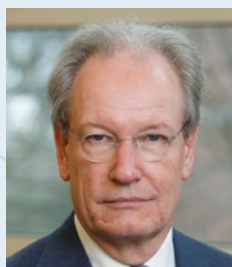
Harm Trip Lid vanaf 1 januari 2020